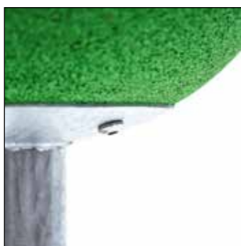
Fixation of Terrasoft floor anchor

(afhankelijk van de weersomstandigheden en funderingsgrootte).